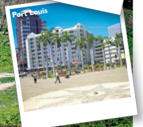
Gris Gris Beach